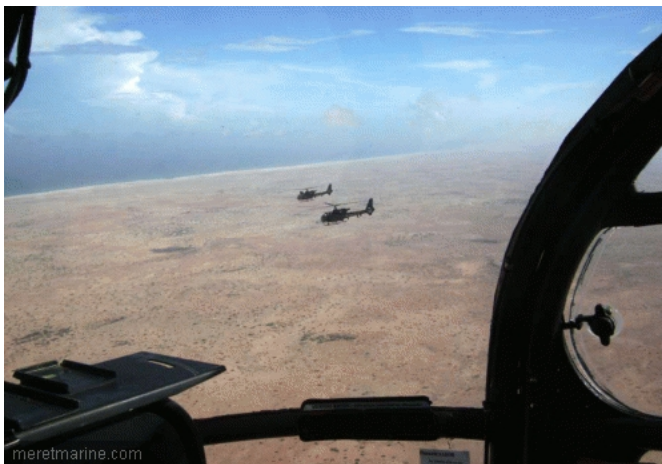
L'intervention terrestre lors de l'opération du Ponant